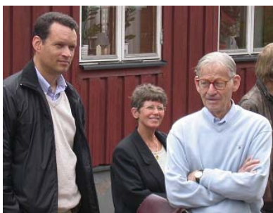
Falun 2003

Fortsättning följer i nästa nummer av "några rader"