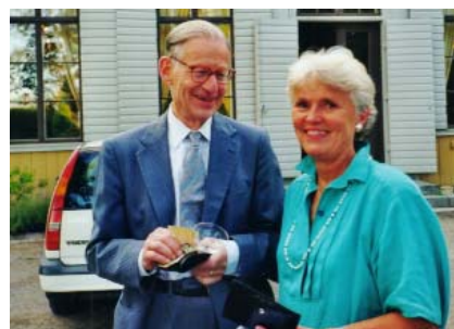
Uppsala 2000