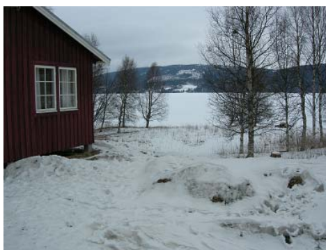
Huså vintern 2006 - vy mot Kallsjön