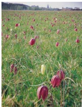
Kungsängsliljan - Fritillaria meleagris L.