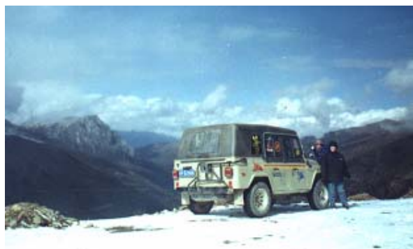
På 4000 meters höjd

YAO", som betyder vill inte ha. Då har dom inte ens varit otrevliga mot mig utan bara envisa (intill vansinnets gräns!!)