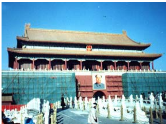
Himmelska Fridens torg i Beijing

Efter att ha rest 10 dagar i det svinkalla norra Kina under de mest primitiva förhållanden, så får jag den 15:e december ett mail från Pappa där det står: "Hej! Jag är i Beijing."