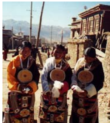
Tre giftasfärdiga flickor i Litang

Kinas framtid kan man sja om. Jag tror aldrig jag sett så många nybyggda skyskrapar och byggkranar som i Kina, och de fanns överallt. Landet är inne i en ekonomisk utveckling som saknar motstycke på jorden. Om regeringen sköter sina kort rätt så har vi att göra med en av framtidens supermakter, som inom kort kommer att börja tävla mot USA. Tänk er själva, 1300 miljoner människor som tycker om att jobba och ett land med stora tillgångar på mineraler, vattenkraft och dylikt... Grejen är regeringen.