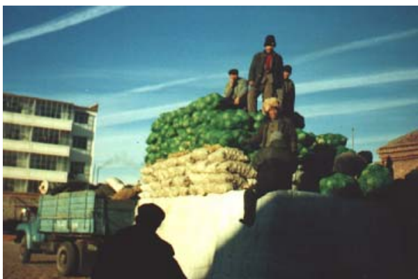
Lastbil på väg till Ulan Bator