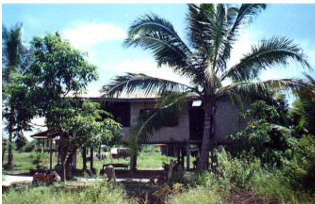
Ett vanligt hus på landsbygden

PS: En annan sak om kineser: de har sällan mössa på sig, även om det är -5 grader ute. Jag har en knallgul mössa som det står "kompis" på, och den trivs jag med!