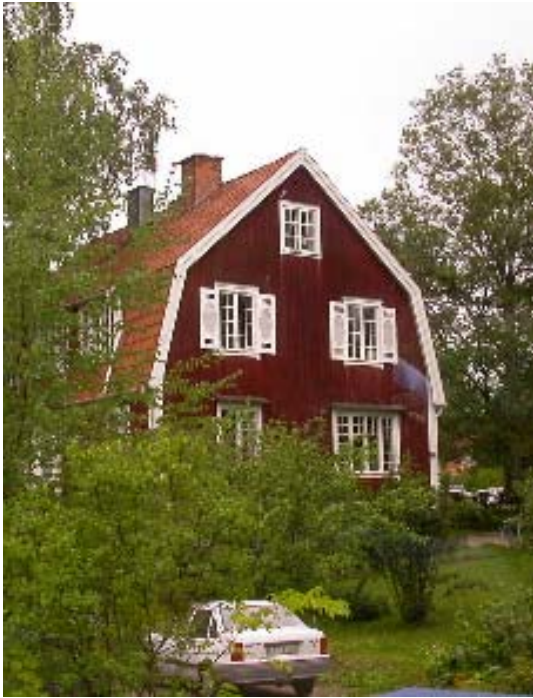
Kyrkbacksvägen 3 i Falun där Axel Lalander med familj bodde